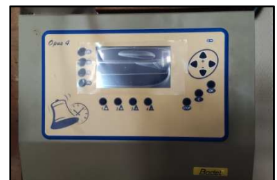
Boîtier de commande et de programmation

A noter : La nuit de 23h00 à 7h00, les cloches ne sonnent plus les quarts d'heure mais uniquement les heures.